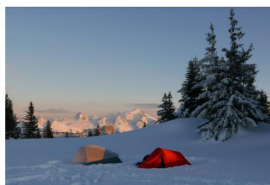
Nuit en bivouac au Plateau des Glières