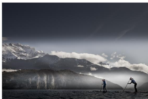
Stand Up Paddle