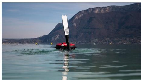
Apnée dans le lac