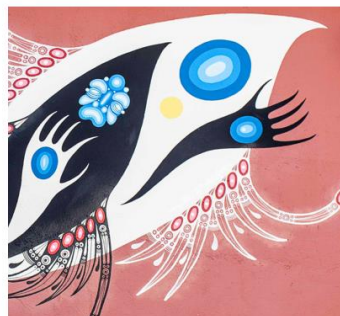
La Virée – parcours street art