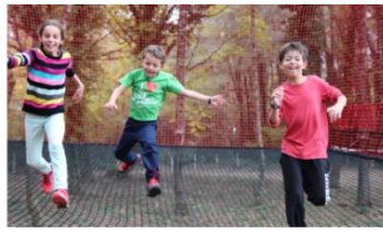
Criq Parc © E. Andreyts et Acro 'Aventures à Talloires-Montmin © Altus