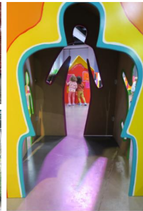
Exposition « Bouge ton Corps » à La Turbine Sciences