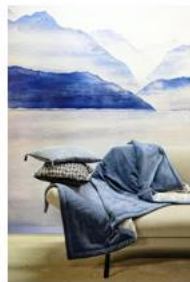
Boutis de lit Constelle Home