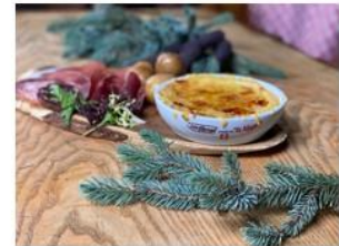
La boxe à fromage Green Yaute