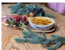
La boîte à fromage Green Yaute A partir de 30€