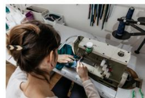
Atelier de couture