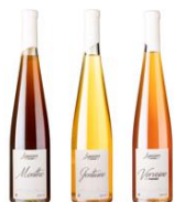
Liqueurs Granier A partir de 34 € L'abus d'alcool est dangereux pour la santé, à consommer avec modération.