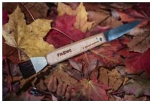
Couteau à champignon Fabwé