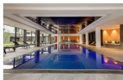
Spa Nuxe Le Rivage A partir de 60 € les 30 minutes