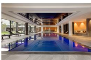
Spa Nuxe au Rivage

A vivre en famille ou en solo, Elisa ouvre ses portes pour l'apprentissage de la couture au travail d'un projet précis. Toutes les formules sont possibles pour s'initier à l'art de la couture ! Matériel possible en prêt. A partir de 30€ pour 1h – 1 personne – à domicile ou dans l'atelier à retrouver Rue Bulloz à Annecy. www.leonjustinannecy.fr