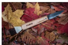
Couteau à champignon Fabwé A partir de 27€