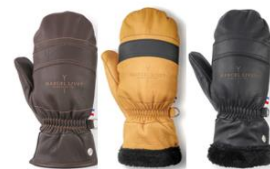
La paire de Moufle 100% cuir A partir de 149 €