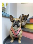
The Woof Concept Store pour animaux