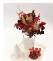
Création florale Borgona 55€