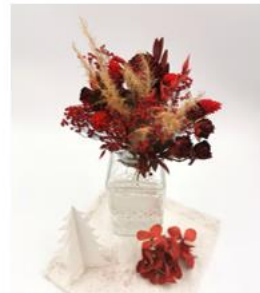
Création florale Borgona