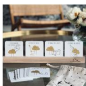
Nuage éducatif Les Petites Hirondelles 40€