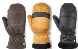
Mouffes Marcel Livet