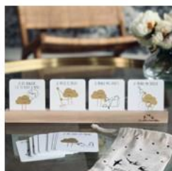
Nuage éducatif Les Petites Hirondelles

Ce porte-bébé ultra technique et minimaliste est inspiré des Onbuhimo japonais, des porte-bébés sans ceinture ventrale. Il permet de porter un bébé en frontal à partir de 6 mois, lorsqu'il est capable de s'asseoir tout seul, de porter les plus grands dans le dos, jusqu'à 20 kg. Avec son poids plume de 290 gr, il se range dans sa poche et peut être facilement glissé dans un sac. Il est idéal lorsque les petits ne veulent plus marcher, en randonnée ou dans les musées. Des sacs et accessoires au look urbain pour améliorer le quotidien durablement, conceptualisés depuis Annecy-le-Vieux. 115 € - www.meromero.fr