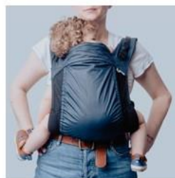
Porte bébé MeroMero