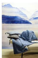
Boutis de lit Constelle Home A partir de 119€