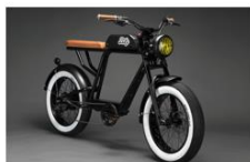
Vélo BIKLE A partir de 2500€