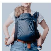
Porte bébé MeroMero 115€